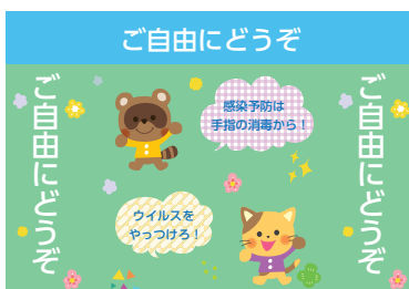
折畳式全面サインパネル