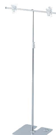
ポップスタンド (レンタル)