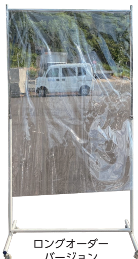
ロングオーダーバージョン

透明性の高い 0.2 mm のシートを 1,300 mm 幅から、ご希望の長さにカットいたします。パイプに両面テープで固定して、設置するだけで、飛沫防止が行えます。