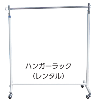
ハンガーラック (レンタル)