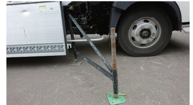
揺れ止め部材 (前部)