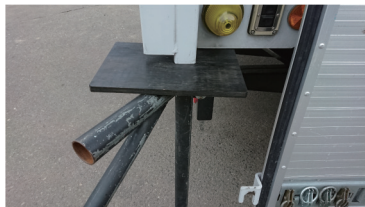
揺れ止め部材 (後部接写)