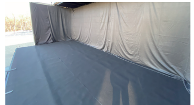
暗幕・パンチカーペット