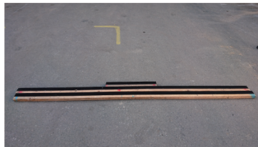
アオリ部ステージスカート支持部材