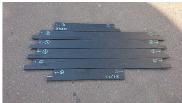
アオリ隙間埋め部材