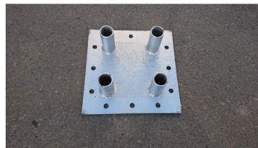
トラス・ジャッキ接合部材