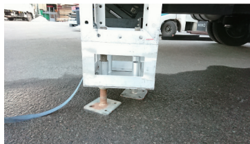
トラス・ジャッキベース