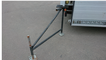
揺れ止め部材 (後部)