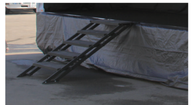
5段階・ステージスカート