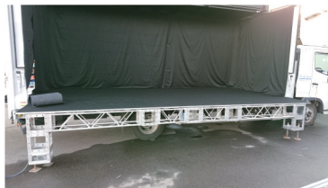
アオリ支持部材 (タイプB・C)