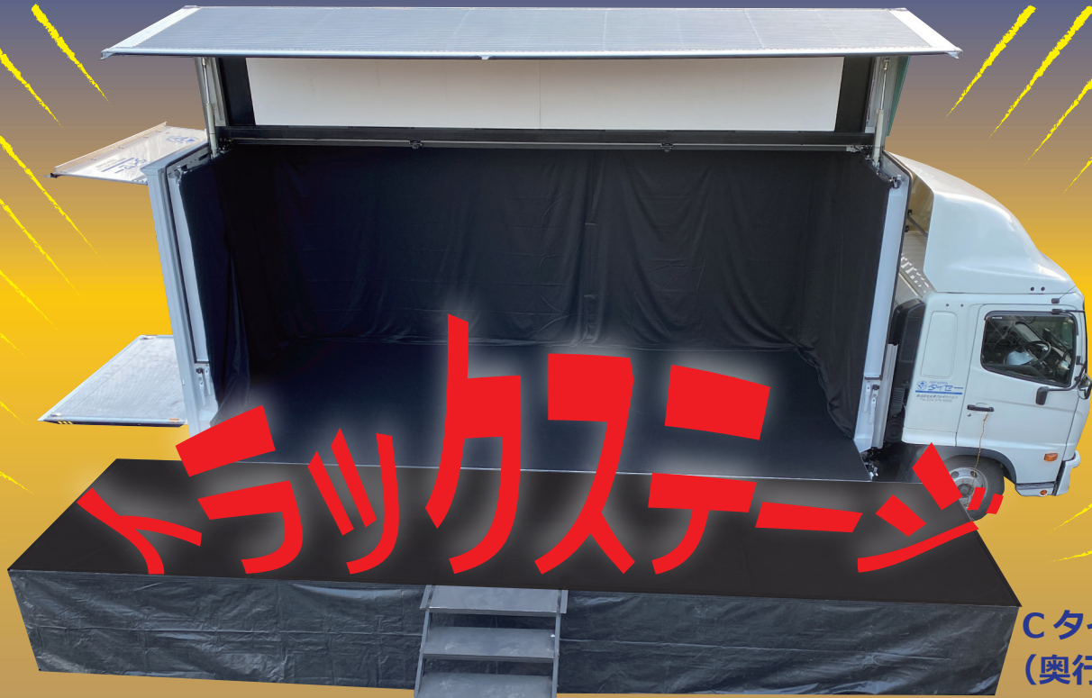
Cタイプ (奥行 5,000 mm)