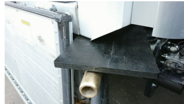
揺れ止め部材 (前部接写)